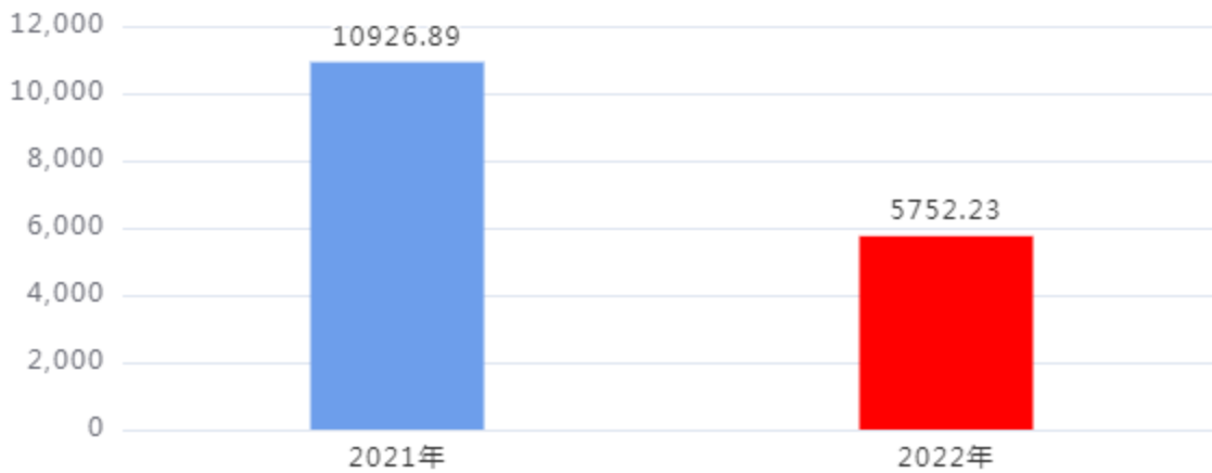
收入、支出决算总计对比图（单位：万元）

2022年度收入总计、支出总计均为5,752.23万元，与上年相比收入总计、支出总计均减少5,174.66万元，下降47.36%，下降的主要原因是：维修工程项目设施投资减少。