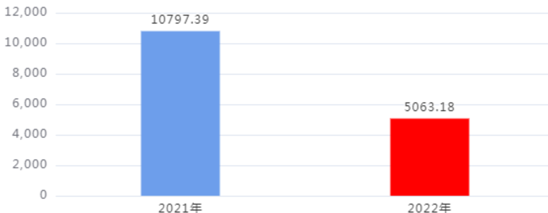
财政拨款收入、支出总计对比图（单位：万元）