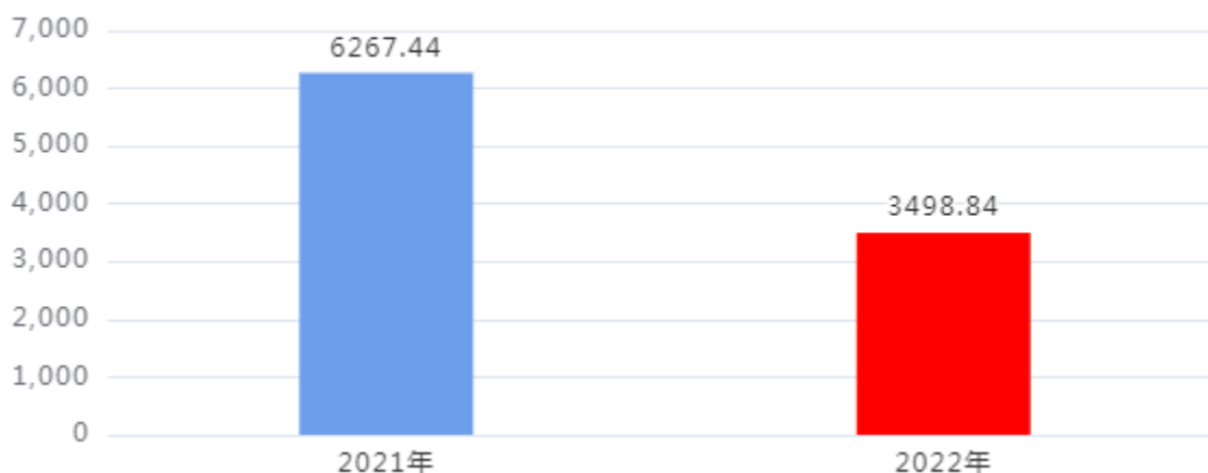
财政拨款支出对比图（单位：万元）

2022年度一般公共预算财政拨款支出年初预算2,060.31万元，支出决算3,498.84万元，完成年初预算的169.82%，占本年支出合计的60.83%。与上年相比，财政拨款支出减少2,768.6万元，下降44.17%，下降的主要原因是：维修工程项目设施投资减少。